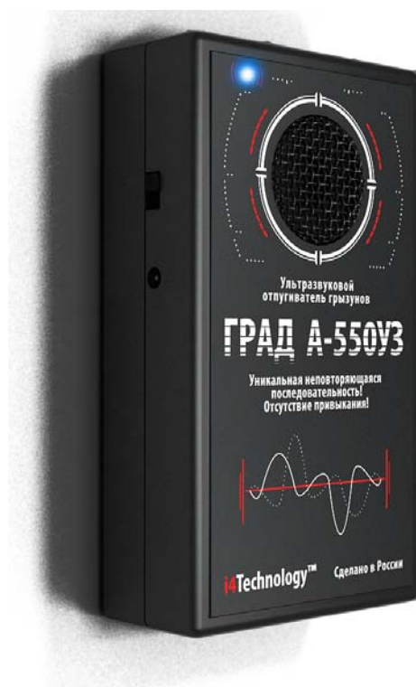
Рисунок 1 – внешний вид прибора

1.2.1 Внешний вид изделия представлен на рисунке 1